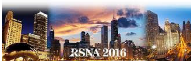
RSNA 2016 Chicago, EUA

No RSNA 2016 foram premiados os seguintes trabalhos de autoria de radiologistas portugueses: