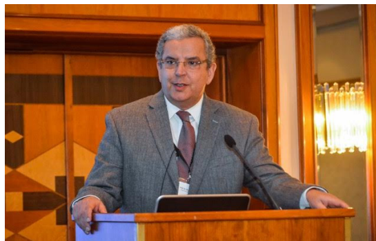
Figura 1 - Presidente da Sociedade Portuguesa de Radiologia e Medicina Nuclear, Prof. Doutor Filipe Caseiro Alves

A distinção foi entregue durante o congresso da ESGAR 2016 ( http://www.esgar.org/annual-meeting/esgar-2016/ ) que decorreu em Praga (República Checa) de 14 a 17 de junho.