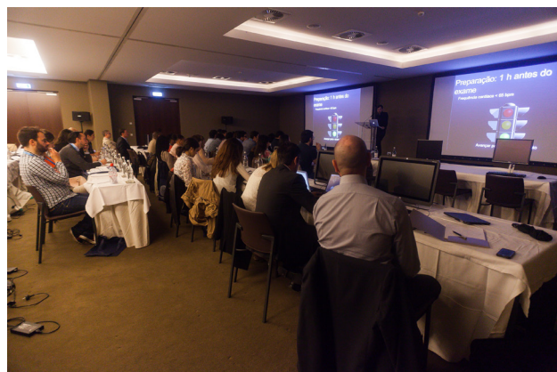
Figura 3 - Curso Pré-Congresso - Hands-on de TC Cardíaca