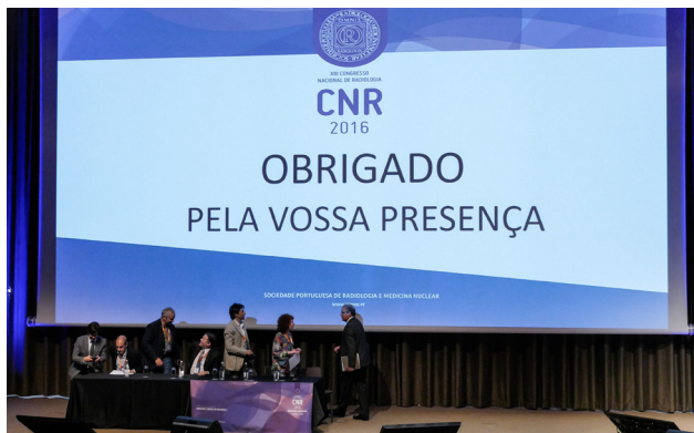
Figura 13 - Encerramento CNR 2016

Como sempre há lugar a melhorias, estando a SPRMN interessada em ideias e opiniões que podem fazer chegar pelo seu email.