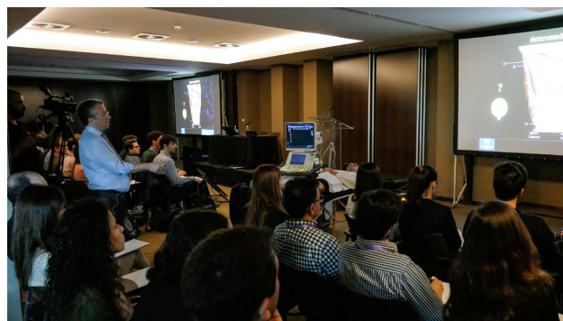
Figura 2 - Curso Pré-Congresso - Hands-on de Ecografia Músculo-Esquelético