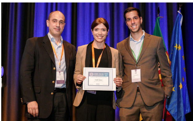
Figura 12 - Entrega de Prémio da Melhor Comunicação Poster