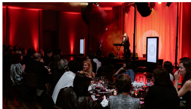
Figura 10 - Jantar de Encerramento