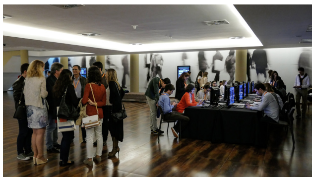
Figura 7 - Exposição Científica e Quiz Radiológico