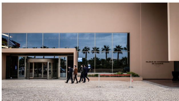
Figura 1 - Palácio de Congressos - Herdade dos Salgados, Albufeira

Não podemos deixar de referir o sucesso do jantar de encerramento do CNR com o concerto do José Cid.