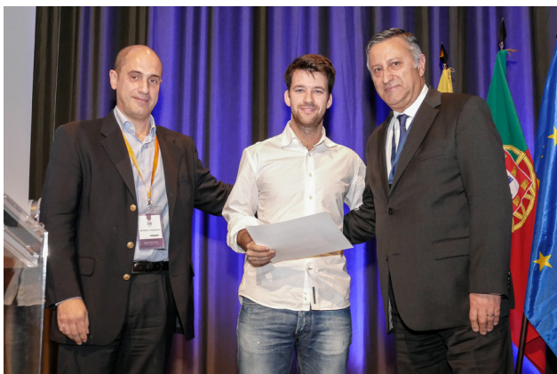
Figura 11 - Entrega de Prémio de Melhor comunicação Oral