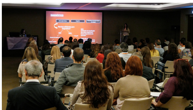
Figura 8 - Sala Monchique - Congresso Técnicos de Radiologia