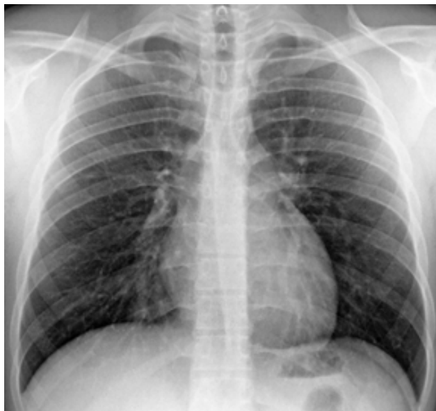
Figura 1 – Radiografia de tórax em incidência postero-anterior.

Paciente do sexo masculino com 20 anos inicia seguimento na consulta de hipertensão arterial. O médico assistente para estudo da hipertensão arterial, diagnosticada há cerca de 4 meses, entre outros exames, não imagiológicos, requisitou ao nosso serviço a realização de uma radiografia de tórax e de uma ecografia renal com estudo Doppler, sendo que a informação clínica fornecida foi: “Hipertensão arterial em estudo”.